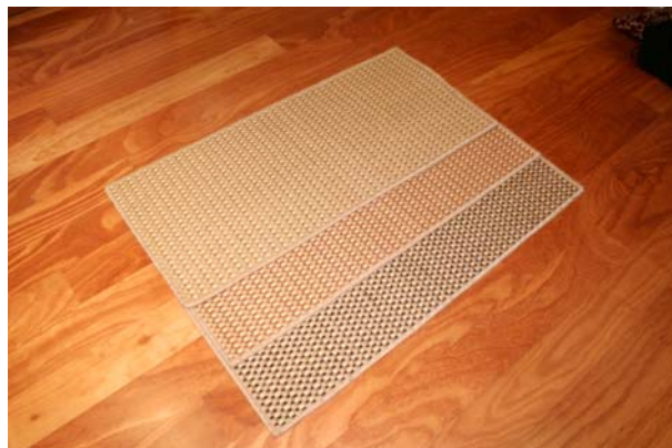
100% sisal Tango 4 cores Tamanho: à medida do cliente com debrum