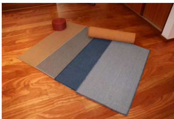
100% Sisal Cores: laranja, azul, azul bebé, cinzento, bege Tamanho: à medida do cliente