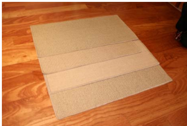
100% sisal Tamanho: à medida do cliente com debrum