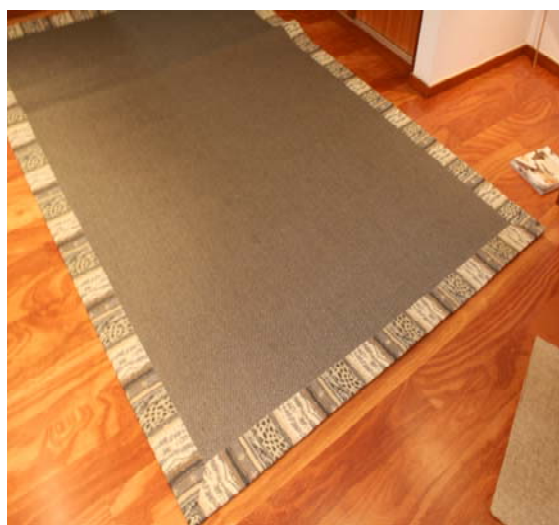
100% Sisal Pintado Sisal com barra de Chenille Tamanho e cor: à medida e gosto do cliente