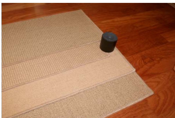
100% Sisal Tamanho: à medida do cliente